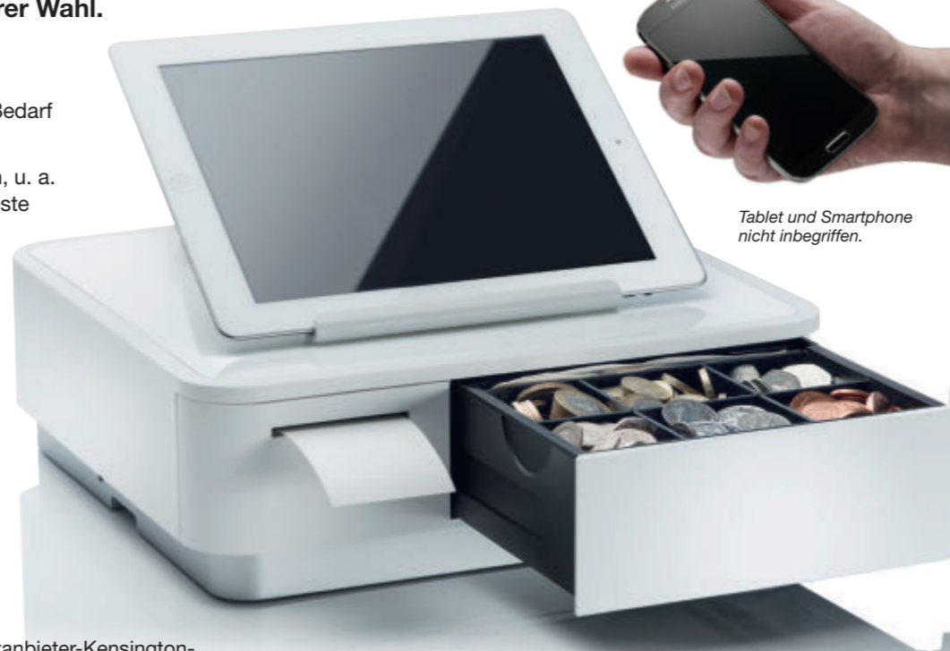
Tablet und Smartphone nicht inbegriffen.

Unter www.mPOP.com finden Sie Informationen zur neuesten Software für mobile POS-Systeme, Einzelhandel und Gastronomie, die Ihre Anforderungen erfüllt und mit dem mPOP von Star funktioniert. Nutzen Sie alle Vorteile mobiler POS-Systeme, wie günstigere Hardware und Software, die in der Cloud und offline funktioniert, damit Sie überall Zugriff auf Ihr Unternehmen haben, ganz wie Sie es wünschen!