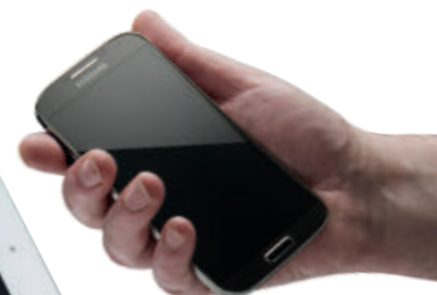
Tablette et téléphone non inclus.

« Utilisez votre propre tablette, smartphone ou ordinateur portable et appareil de paiement »