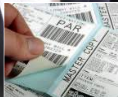
Barcodes, Etiketten, Belege und Tickets mit einem einzigen Modell