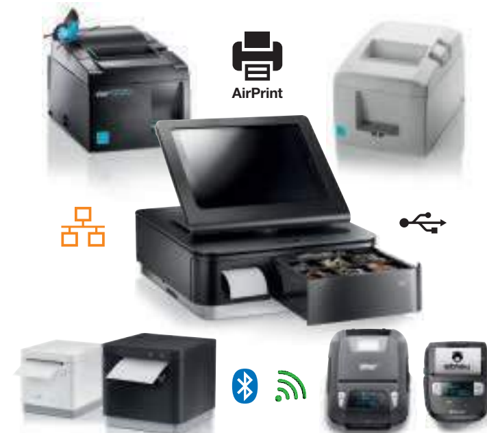
Details zu mobilen Druckern finden Sie auf Seite 21–23.