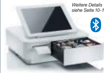
Weitere Details siehe Seite 10-11

NEU mPOP – Bluetooth-Drucker-/Kassenschubladen-Kombination