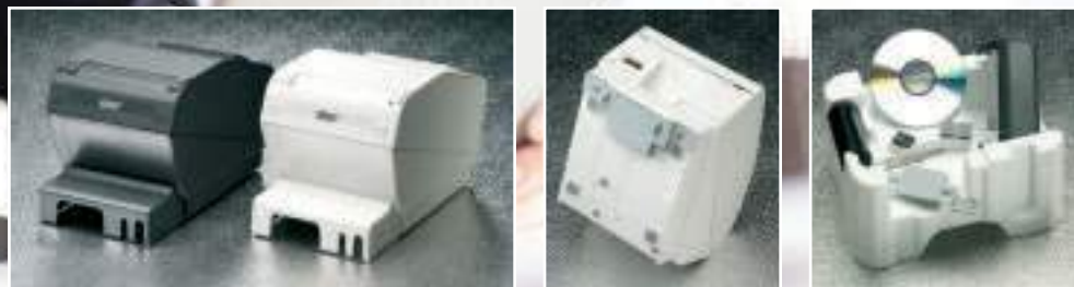
Zubehör im Lieferumfang: Treiber-CD, Halterungen für Wandmontage, Abdeckungen für Schnittstelle und Netzschalter