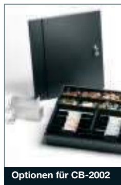
Optionen für CB-2002