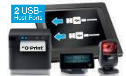
Star mC-Print3, TSP143III- und TSP654II-Serie mit Apple AirPrint™ sowie Sanei-Serie

Ideal für Anwendungen, bei denen kostengünstige Tablets aufgrund ihrer Kompaktheit (flaches Profil), Benutzerfreundlichkeit und vernetzten Dienste an Standorten eingesetzt werden, an denen vor Ort anwesende Mitarbeiter die Druckmedien auffüllen können. Der mC-Print3 und die HI X-Druckerserie von Star vereinfachen das Kioskdesign als Hub mit zwei USB-Host-Ports zum Anschluss des Symbol/Zebra 2D-Scanners DS9208 und des Star Kundendisplays SCD222. Zudem ermöglichen sie eine Remote-Kommunikation.