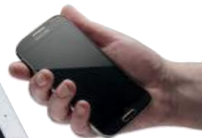
Tablet und Smartphone nicht inbegriffen.

„Verwenden Sie Ihre eigenen Tablets, Smartphones, Laptops und Bezahlgeräte.“