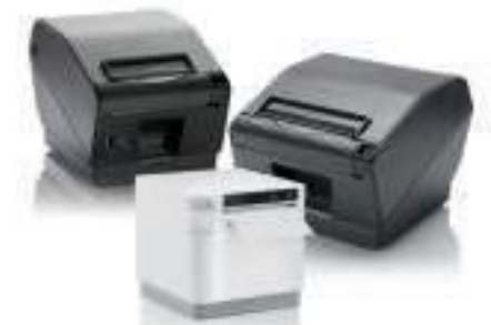
Star TSP700II, TSP800II und mC-Print