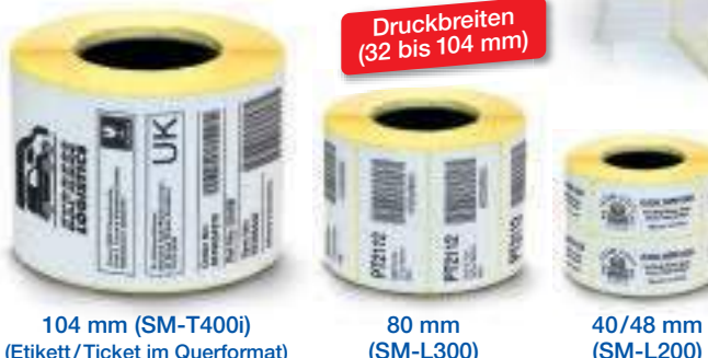
104 mm (SM-T400i) (Etikett / Ticket im Querformat)

Für weitere Informationen über das Erstellen von Etiketten mit unseren mobilen Druckern kontaktieren Sie Star bitte per E-Mail an support@star-emea.com